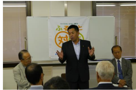
← みよし市、豊田市の商工関係者と八木哲也・衆議院議員や地元の県議会議員、市議会議員さんも。

愛知県みよし市足助町と豊田市で開催された集會に行ってきました。党全体では、570・571回目の会です！