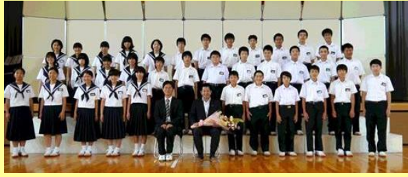
← 白川町佐見地区の保育園・小中学校の保護者と5・6年生、中学生に、「夢」をテーマに話をしました。

自慢の合唱や、花束のプレゼントまでいただき、長かった国会の疲れも吹き飛びました！