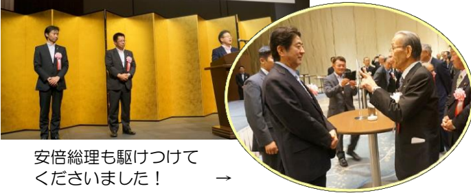
安倍総理も駆けつけて くださいました！ →

同日開催された「小規模企業政策の充実について感謝する集い」は、参議院本会議の時間と重なってしまったため、冒頭のみのお出席となりましたが、都道府県連の役員、衆議院議員、中小企業庁、関連団体などから大勢の方が集まり、大盛会でした。