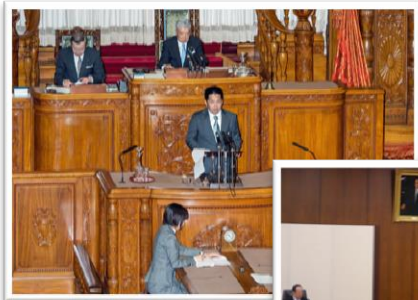
↑ 本会議で報告 → 衆議院農林水産委員会に出張！

普段は、議事進行役。 残念ながら質問には立てませんが、発言者の指名、傍聴や撮影・録音の許可など、最初から最後まで気が張り詰めています。