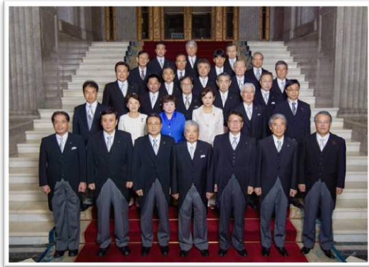
← 国会議事堂の中央広間にて記念撮影。

国会開会式の際に天皇陛下のご送迎をしたり、「常任委員長懇談会」という、委員長だけの会議に出席して会期や会期延長について話し合うのも仕事です。農林水産業関係の行事に、院の代表として出席することも多くあります。