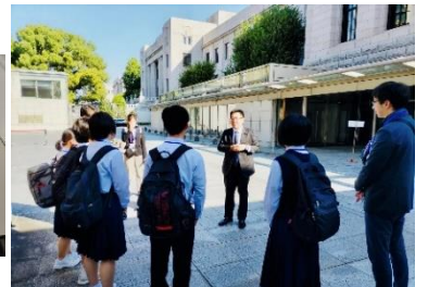
修学旅行ももどってきました。東白川中学校のみなさんと。