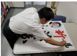
時間があるときは為書きも自分で筆をとります！