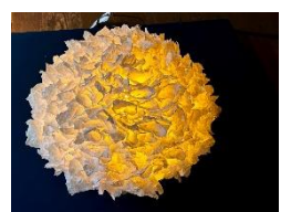
美濃和紙あかりアート展