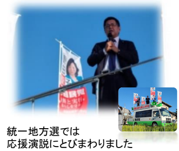
統一地方選では応援演説にとびまわりました

2023年夏はとにかく暑くて長い夏でしたが、元氣な皆さんのお顔を拝見してたくさんのパワーをいただきました！