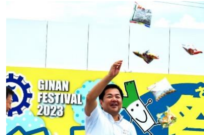
「よってきん祭ぎなん」豪快にお菓子まき！