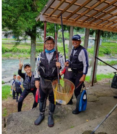
東白川村商工会 建築部会主催 「鮎釣り大会」 2年ぶりの結果は・・・涙