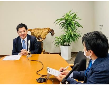
CBCラジオ「ふるさと国会便」収録中。。。